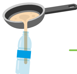
Použitý olej zbierať do PET fľaše