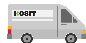
Odvoz na recykláciu