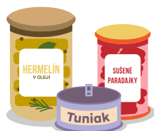
Potraviny s jedlým olejom / tukom