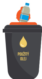
Naplnenú uzatvorenú PET fľašu vhodiť do určenej nádoby